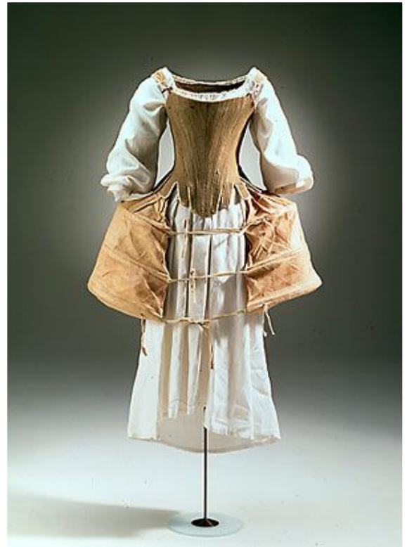
Каркасы для юбок - панье