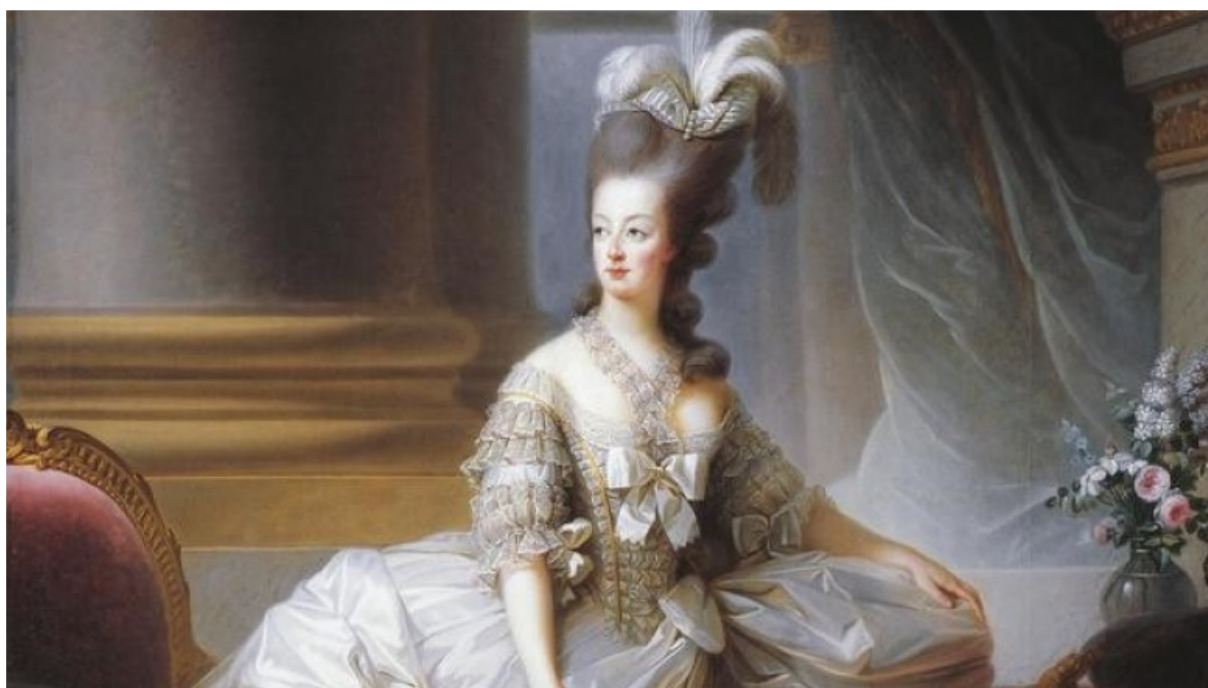
Прически XVIII века.