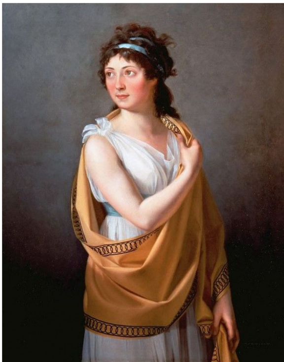
Ж.-Л. Давид, портрет Терезы Тальен