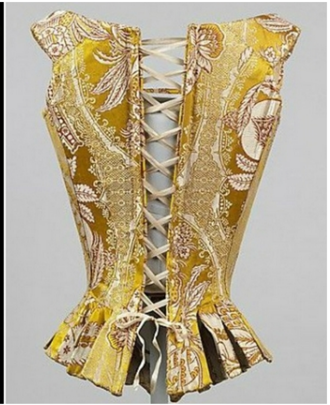
Карсеты со шнуровкой