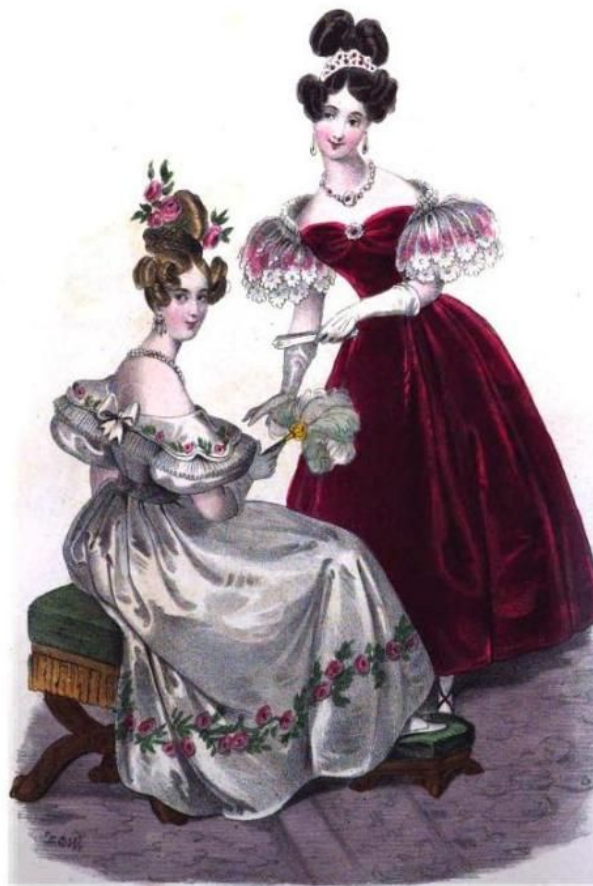
ENGLISH FASHIONS FOR DECEMBER.

Не случайно А.С. Пушкин посвятил в «Евгении Онегине» столько поэтических строк женским ножкам: