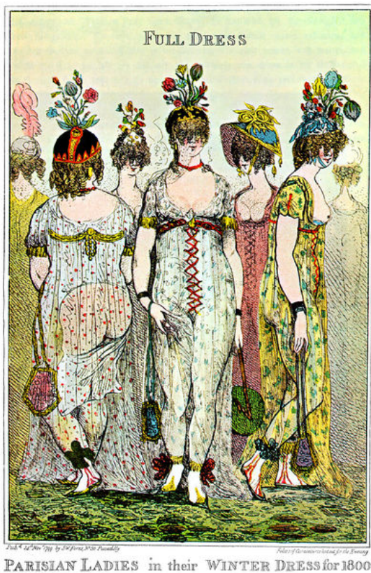
PARISIAN LADIES in their WINTER DRESS for 1800

Женщины сбросили с себя все каркасы и подкладки, все старые одежды, вплоть до нижней, и надели трико телесного цвета (наподобие современного балетного), а поверх него – струящиеся прозрачные муслиновые туники с широкими складками и разрезами на боках, перехваченные под грудью поясом. Эти одежды были исключительно белого цвета. Подражая античным образцам, модницы обувались в сандалии, завязанные вокруг икр длинными лентами. Прически также представляли собой античные копии.