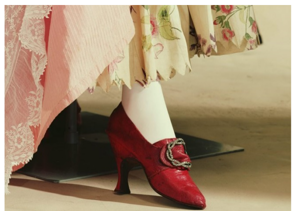
Образцы модных туалетов XVIII века.