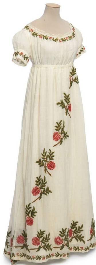
Модные платья начала XIX века.