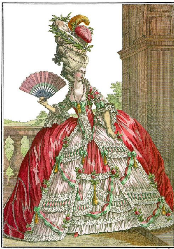
Jeune Dame de Qualité en grande Robe coiffée avec un Bonnet ou Poul' élégant dit la Victoire.

Говорить о том, как бы далее развивалась пышная мода XVIII столетия можно долго, если бы не одно, очень важное событие –