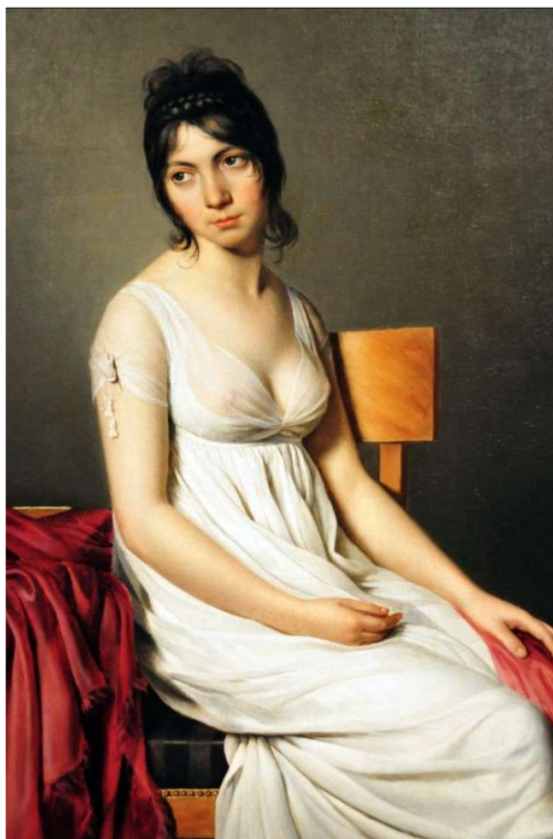
Ж.-Л. Давид, портрет Джованны Донны, 1803 год