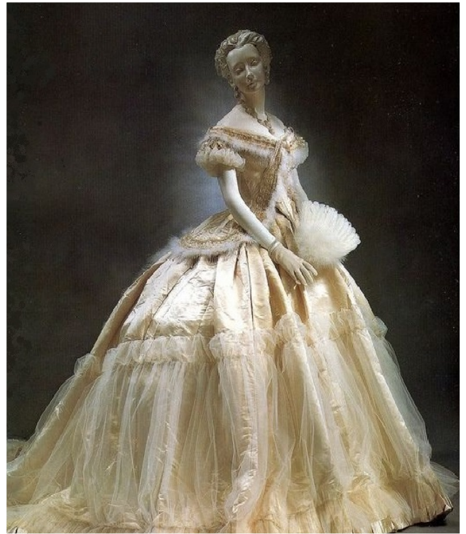
Платье принцессы (образцы платьев 1860-х годов)

Действительно дамы носили роскошные платья из дорогих материй, украшали себя множеством всякой всячины. Но все не так просто. Попробуем разобраться во всех изменениях и тонкостях дамских туалетов, подробнее остановившись на моде пушкинского времени.