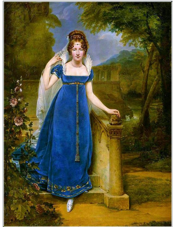
Бархатные платья начала XIX века.

Первое десятилетие века XIX модный мир осваивал новые формы, привыкал к измененным силуэтам, приспосабливался к нововведениям.